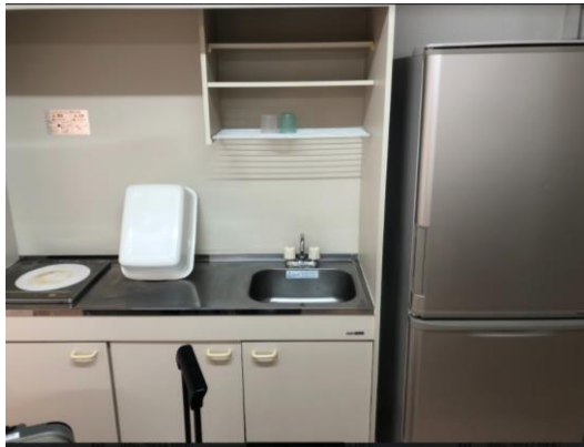
←房間內有冰箱、電磁爐、電鍋等 簡易廚房用具