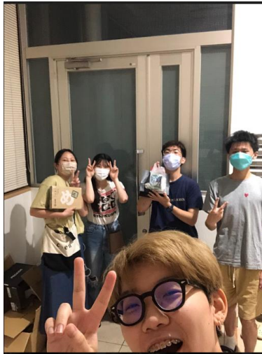
←日本朋友與我們交換禮物

我將透過住、行、食、樂這四部份來解說，但首先我要先感謝久留米大學的國際事務處為我們每一位台灣學生安排學伴以及設計許多交流活動，讓我們可以認識到許多日本的朋友，透過日本當地的朋友可以讓我們更了解當地的文化及風俗，解答我們對日本習慣的問題，甚至幫助我們釐清我們之前對日本的一些誤解。