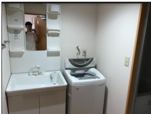
←獨立的衛浴設備及洗衣機