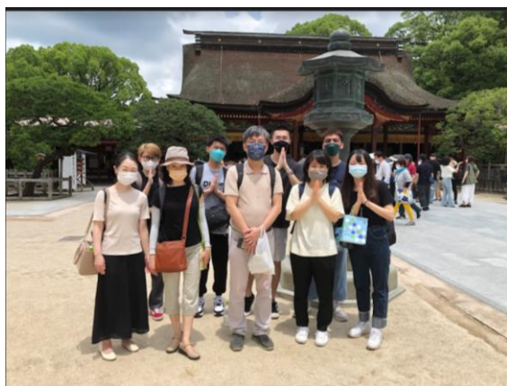
←大家在天滿宮本殿前合影

我們去，太宰府最知名的是天滿宮神社，供奉日本的學業之神，祈求學業順利，不僅是我們學子必參拜的一個地方，更是當地人的信仰中心。當天在參拜的時候，也遇到當地人在天滿宮進行傳統的日式婚禮，大家都為新人獻上鼓掌與祝福，也幸運地可以親身體驗到當地的傳統婚體。