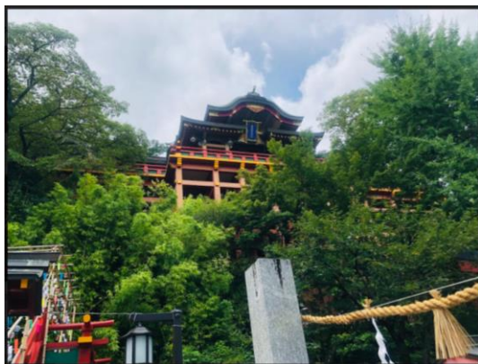
←佐賀縣鹿島市祐德稻荷神社

接下來是學伴開車帶我跟其他兩位日本朋友到佐賀玩，這次的出遊創了我的兩個第一次，第一次做日本朋友的私人小客車出去玩，第一次單獨與日本朋友出去而沒有其他台灣朋友，對我來說是一個非常特別的經驗。