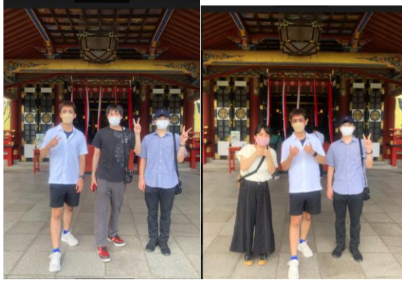
←與朋友在神社前拍照

最後一部分是參與久留米是當地的活動，一個是水的祭，另一個筑後川花火大會，水的祭是由當地各學校或是機構走隊遊行跳舞，而我們加入久留米大學的隊伍，一起與當地人跳舞、遊街，不像觀光客只是觀賞，而是直接參與體驗，非常新奇且獨特的體驗。另一個是筑後川的花火大會，在久留米大學附近的筑後川河岸所舉辦的一個活動，以往只能透過電視轉播等芳師才能看得到，這次親身體驗，感受當地的氛圍，同時現場也看到非常多當地人穿著浴衣，也是一次非常特別的體驗。