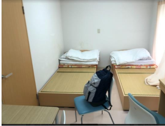
←兩人房(有兩張床及兩組書桌)

至還有簡易廚房、冰箱、浴缸、洗衣機等設備，十分的舒適，而這樣的住宿品質是超越很多台灣的大學宿舍，不僅帶給學生一個舒適的讀書環境，還有便利的休息環境。