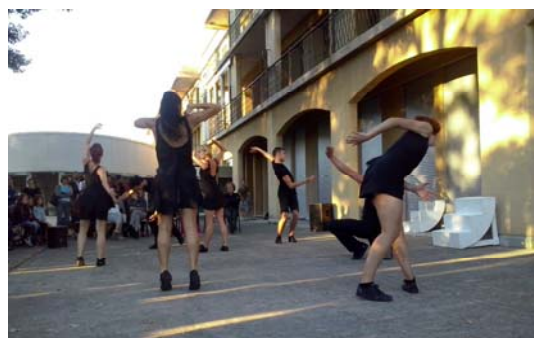
附圖為藝術團體到學校表演舞蹈。