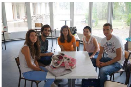
附圖為 Business Game 小組合照